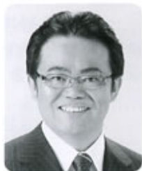
衆議院議員 大村 秀章